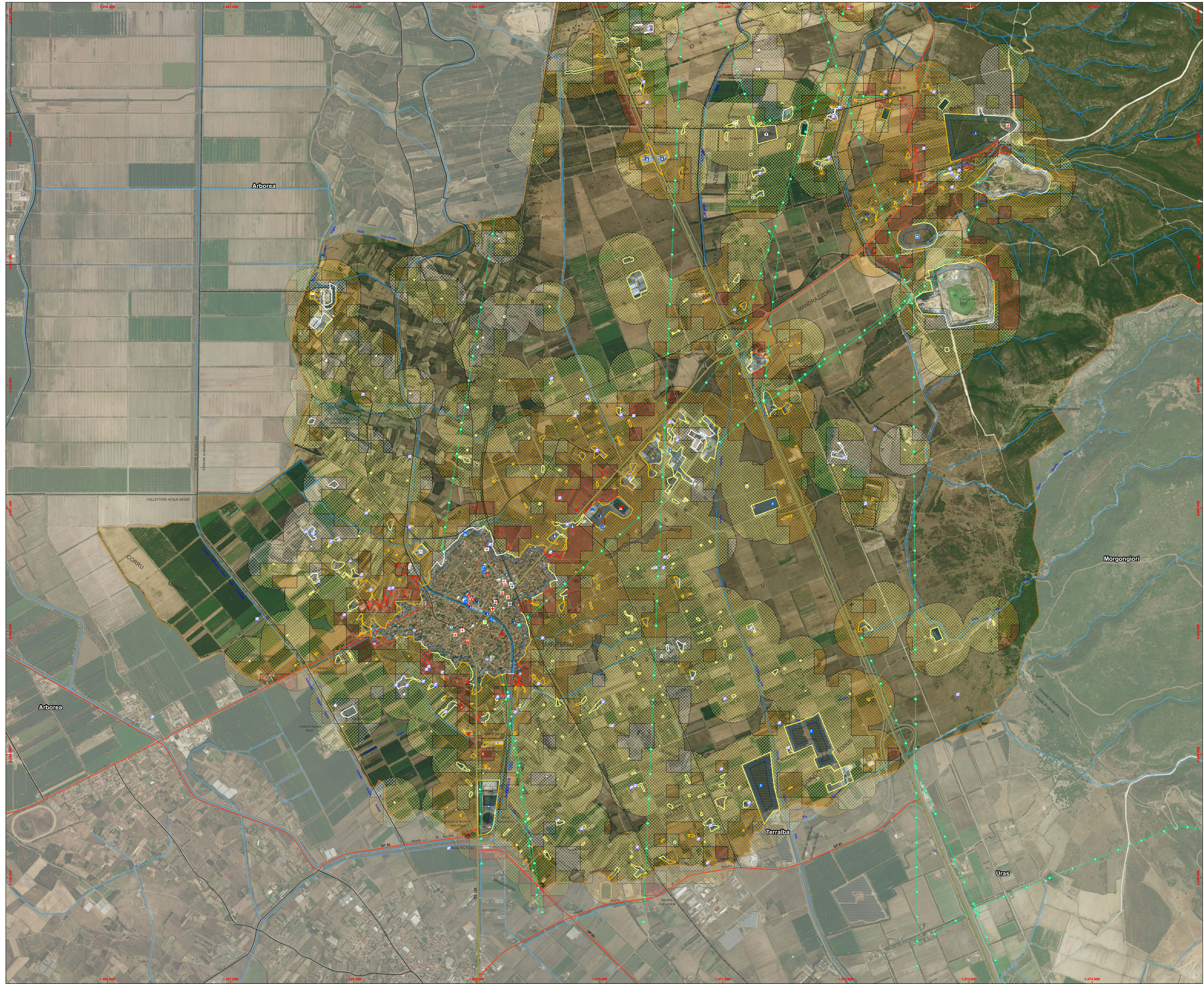
Base di mappa Ortofoto - Coordinate Gauss-Boaga (W)