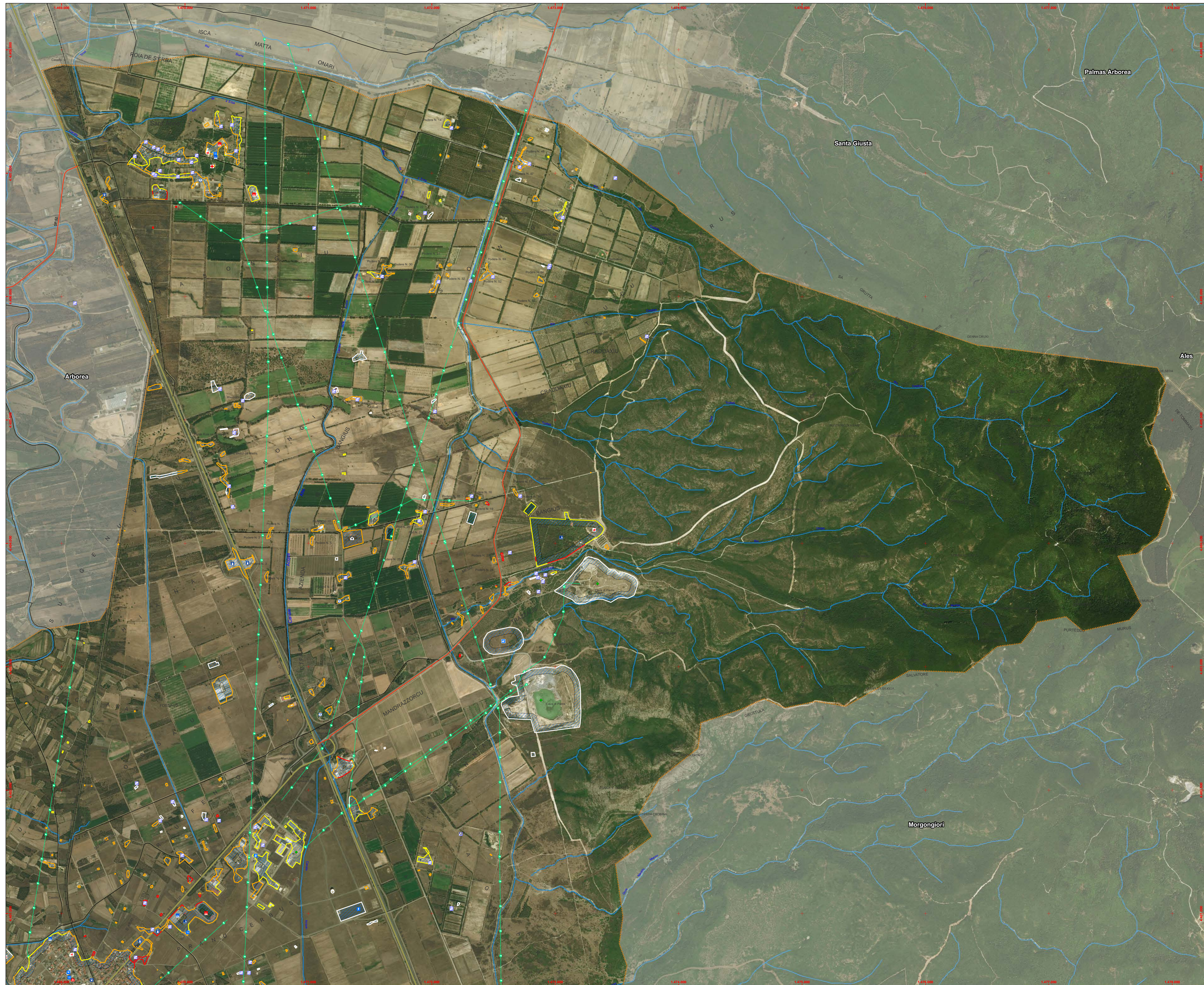
Base di mappa Ortofoto - Coordinate Gauss-Boaga (W)