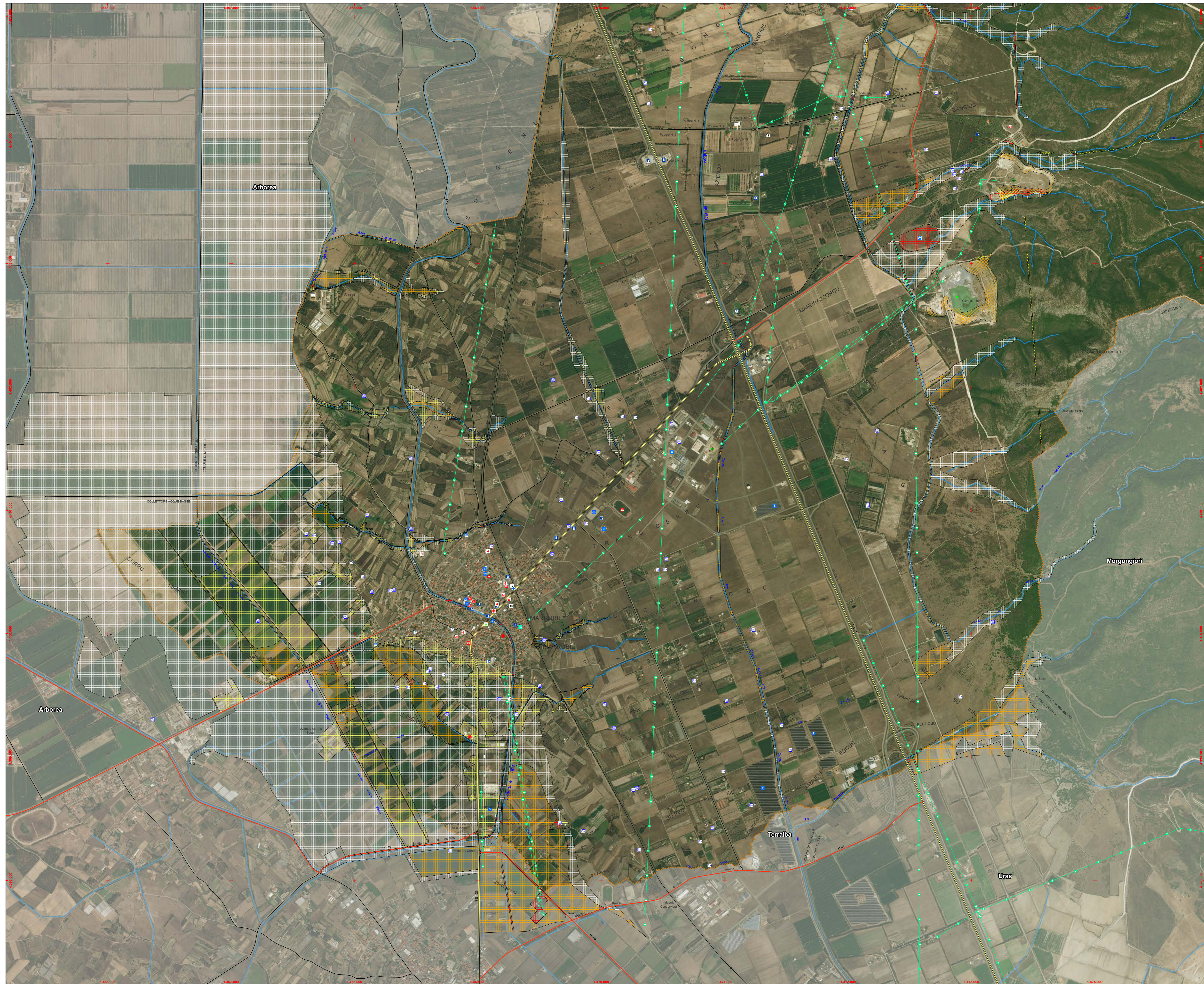
Base di mappa Ortofoto - Coordinate Gauss-Boaga (W)