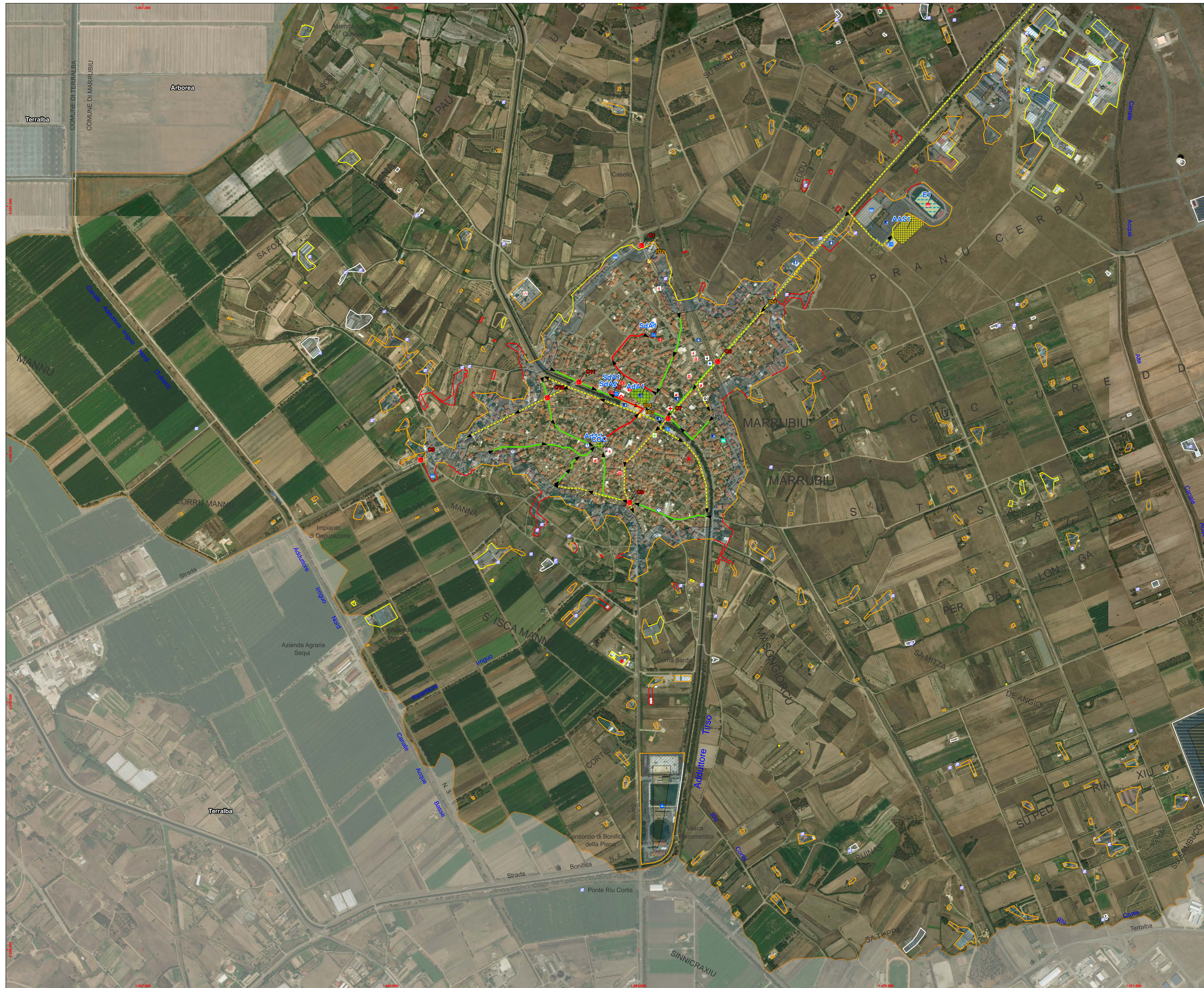
Base di mappa Ortofoto - Coordinate Gauss-Boaga (W)