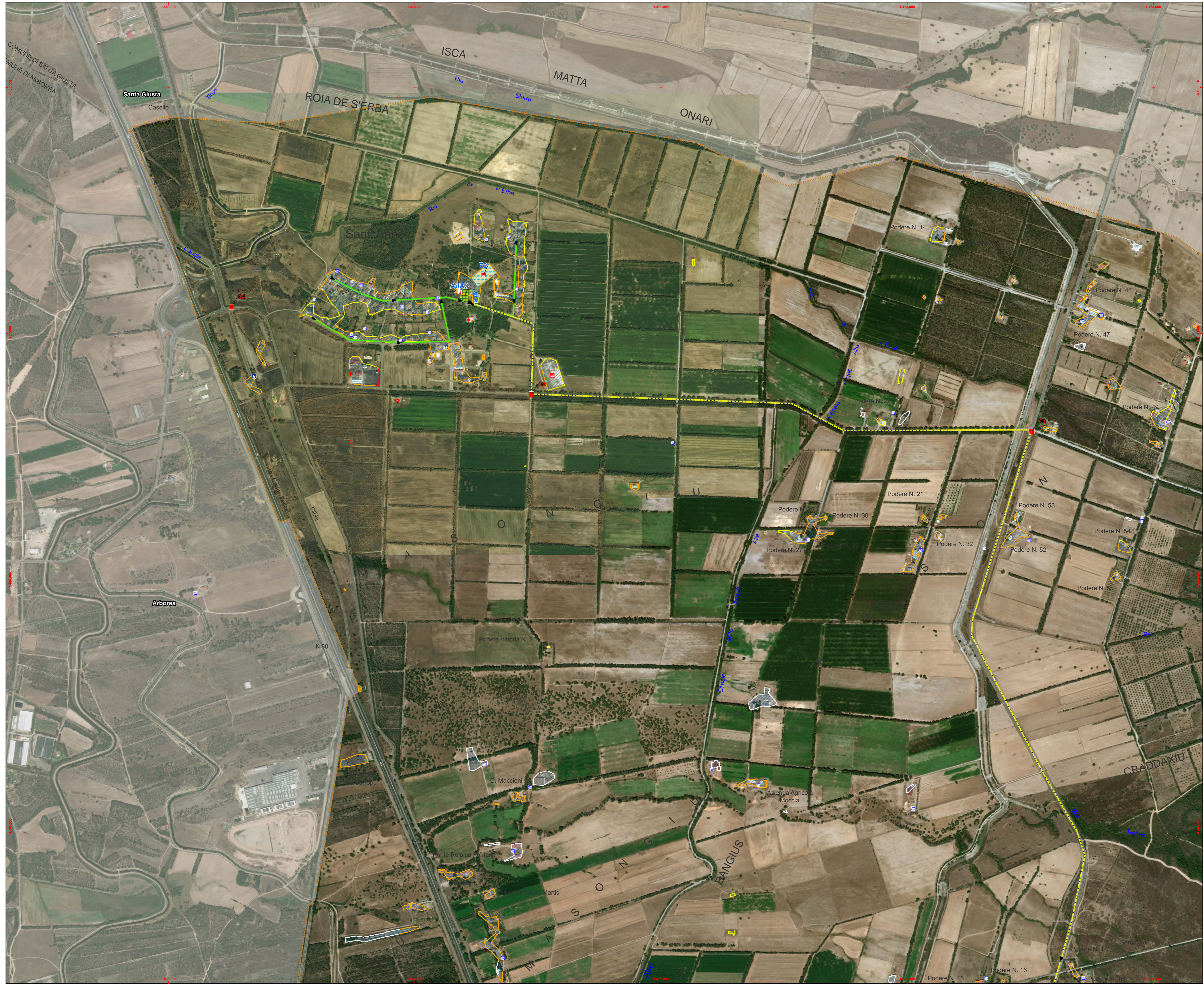
Base di mappa Ortofoto - Coordinate Gauss-Boaga (W)